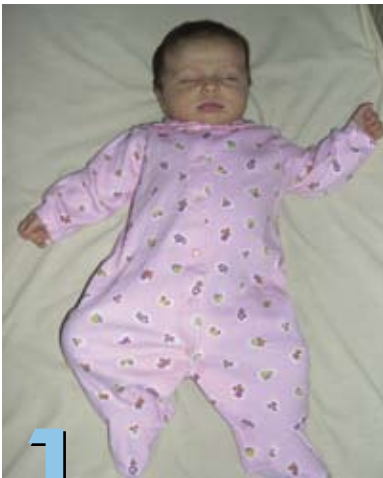
1 Para dormir