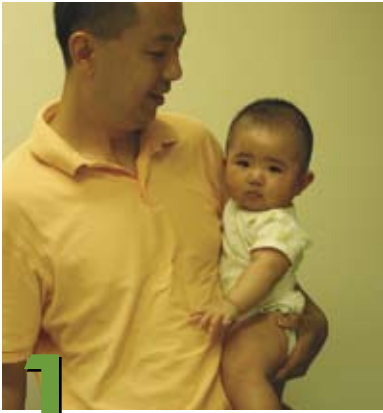
1 Cómo cargar al bebé