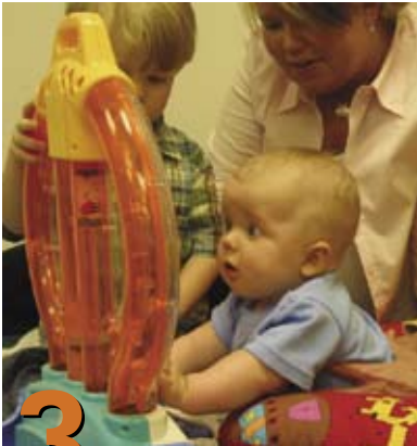
3 Posiciones para jugar