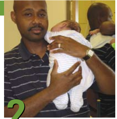
2 Cómo cargar al bebé