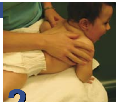
2 Cómo vestirlo y bañarlo