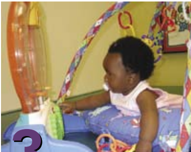
3 Más actividades