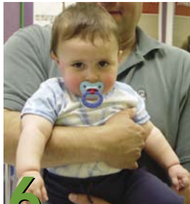
6 Cómo cargar al bebé