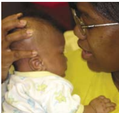
Tiempo para apapachar

Recueste al bebé contra su hombro dándole la cara o teniéndolo suavemente envuelto entre sus brazos. Estos momentos lo animarán a buscarla con sus ojos y a levantar su cabeza. Sosténgalo y céntrale su cabeza y, con suavidad, gíresela para ambos lados.