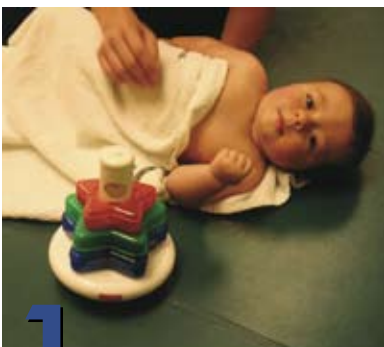
1 Cómo vestirlo y bañarlo