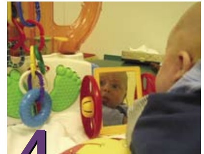
4 Más actividades