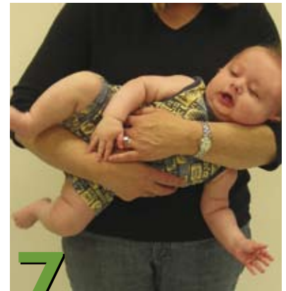
7 Cómo cargar al bebé