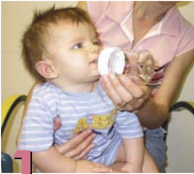
1 Cómo alimentarlo