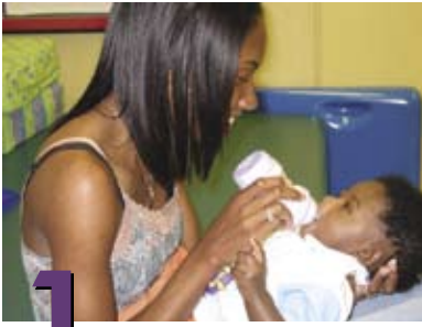
1 Más actividades