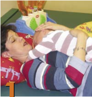
1 Posiciones para jugar