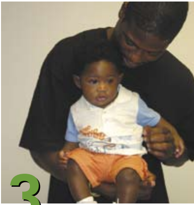
3 Cómo cargar al bebé