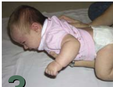
3 Cómo cambiarle el pañal