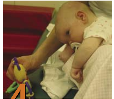
4 Posiciones para jugar