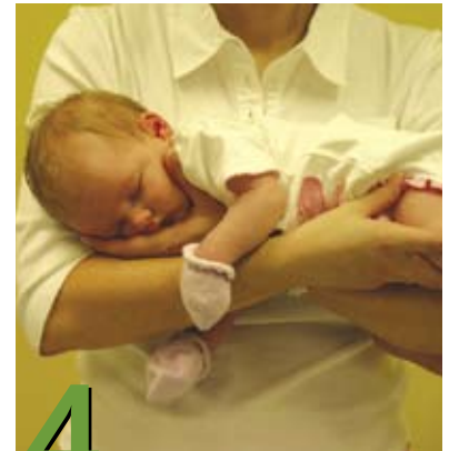
4 Cómo cargar al bebé