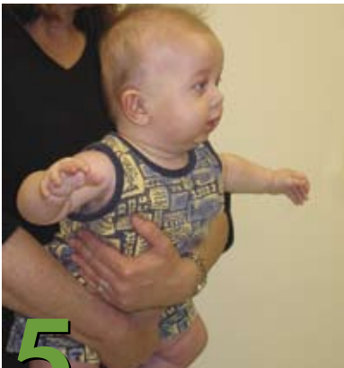
5 Cómo cargar al bebé