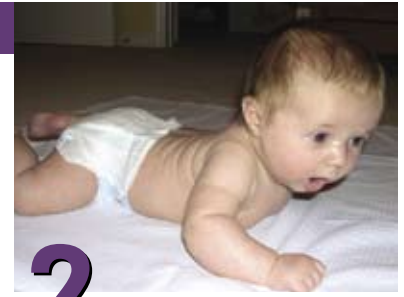
2 Más actividades