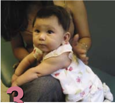
3 Cómo alimentarlo