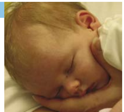
Tiempo para apapachar