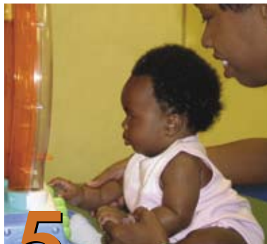
5 Posiciones para jugar