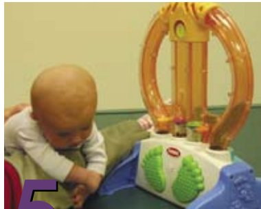
5 Más actividades