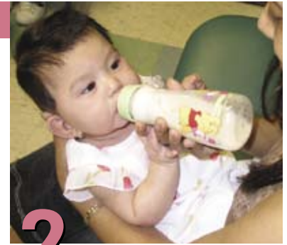
2 Cómo alimentarlo