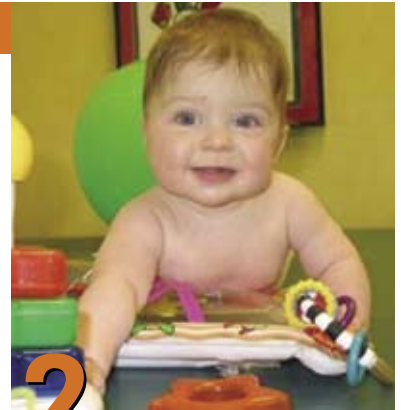
2 Posiciones para jugar