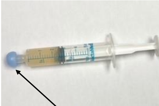
Tapa de la jeringa